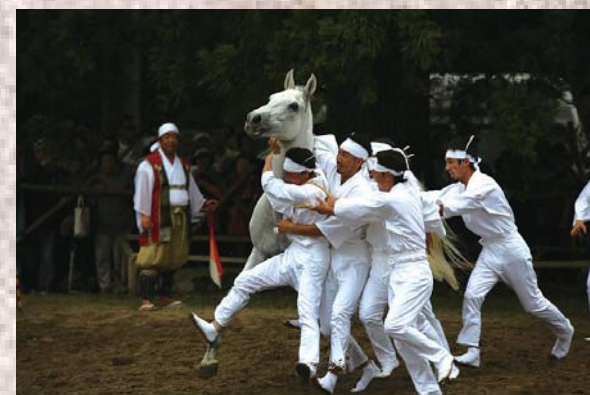
▲御小人が馬を捕らえる