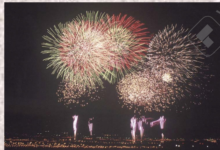
▲火の祭（かがり火と花火）

午後4時00分 帰り馬行列（お上がり）開始【南小高橋南側交差点】 5時30分 御神輿が相馬小高神社へ御還幸 7時00分 火の祭式典開始【小谷橋周辺】 祝詞奏上、挨拶、篝火に点火 30分 花火打上げ【前川堤防周辺】