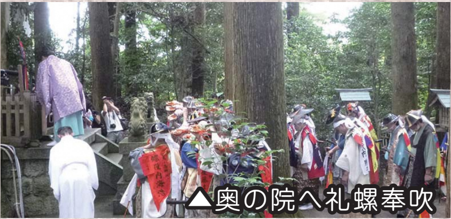
▲奥の院へ礼螺奉吹

午前9時30分 式典開始【相馬小高神社】 奥の院へ礼螺奉吹 45分 拝殿前で御発輦式執行 修祓、礼螺奉吹、祝詞奏上、玉串奉奠、 挨拶、訓示、御神酒拝戴 10時30分 御発輦 宵乗り行列（お繰り出し）開始